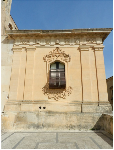
Il nuovo angolo a sud-ovest del Monastero , opera del Capomastro scalpellino Luigi Guastella.